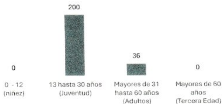
Rango de edad de los alumnos en el Programa de Becas CONADER Año 2025

La gráfica anterior muestra cuantos alumnos hay por clasificación de rango de edad participando en el programa de becas CONADER