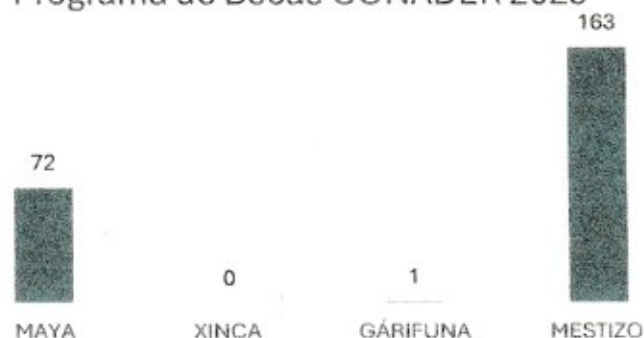
Participación por Grupo Étnico en el Programa de Becas CONADER 2025

La gráfica anterior muestra cuantos alumnos hay por grupo étnico participando en el programa de becas CONADER